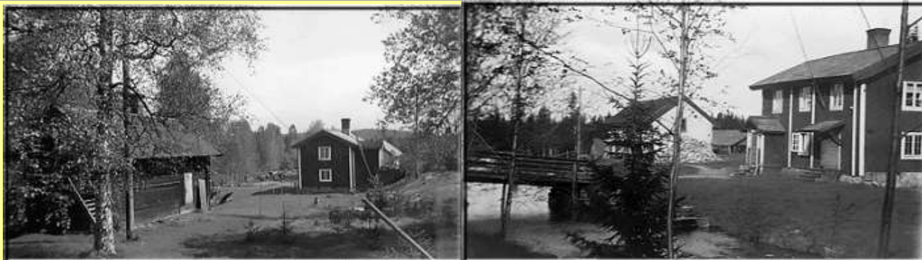
Närmast "Kottstugan" den enda kvarvarande byggnaden i dag och "Lundquistens", mjölnarbostaden med sågen i bakgrunden.