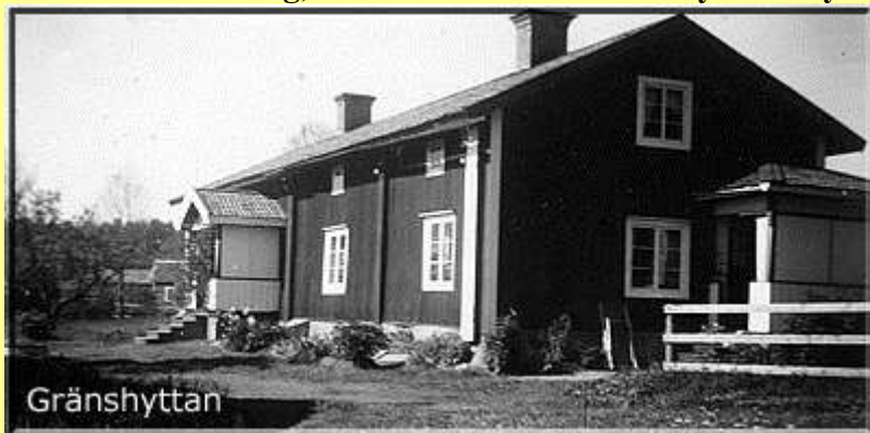
Ett av husen i Gränshyttan, revs på 1960-talet

Inredningen bestod av en kärllhylla, skåp, bord å några stolar, soffa samt vid dörren en vattenså med tillhörande bärstång, ett träkors med stake å klyka för lysstickan avslutade det hela.